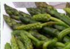
Scarti organici di cucina vegetali cotti