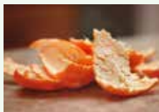
Bucce di agrumi non trattati e smiuzzate