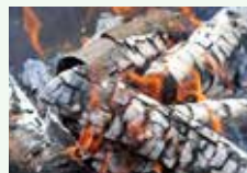
Cenere di legno (non di carbone)