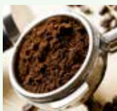
Fondi di caffè o filtri di the