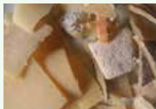
Croste di formaggio