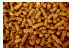
Lettiere vegetali di piccoli animali non carnivori