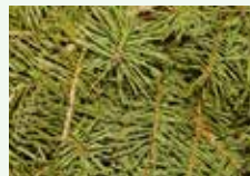
Foglie resistenti alla decomposizione: magnolia, aghi di conifere, castagno, ecc.