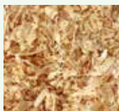
Truciol di segatura