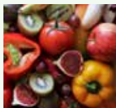
Scarti di frutta e verdura crudi